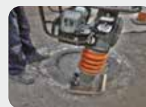
Finition sur asphalte