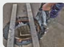
Application du TP-FIX